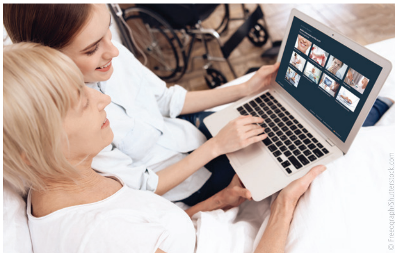
Abb. 1: Mit dem Portal mund-pflege können Pflegekräfte, Angehörige, das zahnärztliche Team und natürlich auch Betroffene selbst von jedem Gerät aus auf umfassende Informationen zur Mundgesundheit bei Menschen mit Pflegebedarf zugreifen.

Die Plattform stellt ein umfassendes Angebot zu relevanten Themen der Mundpflege zur Verfügung. Dazu zählen die